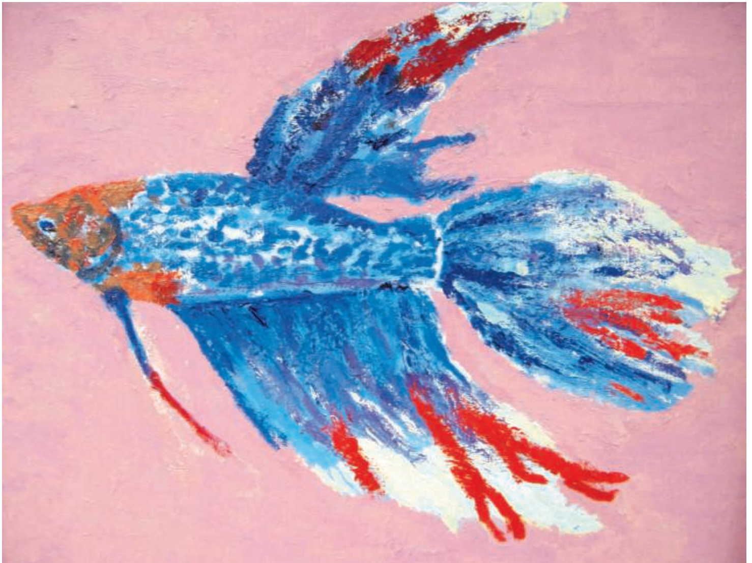
デイサービス利用者さんクラフト講座作品