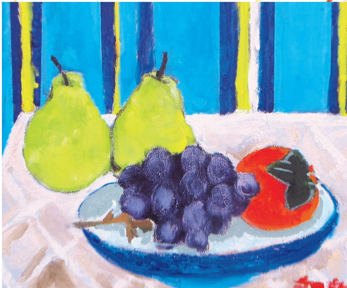
入居利用者さんクラフト講座作品