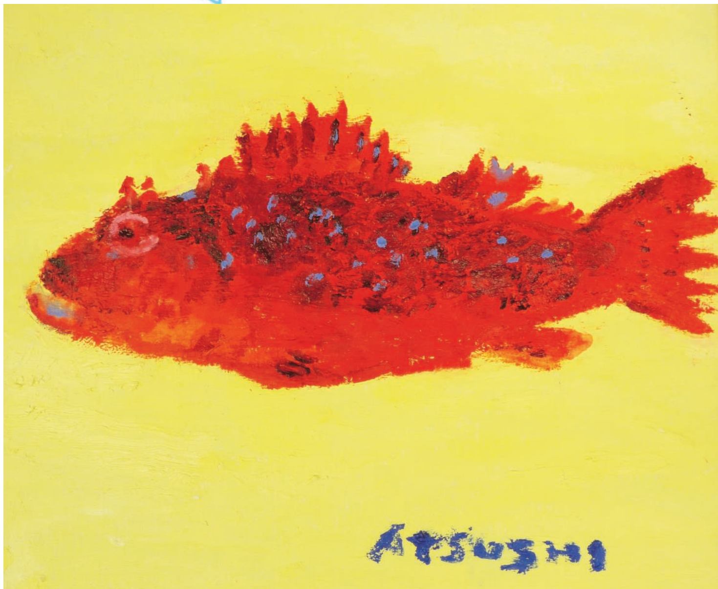
デイサービス利用者さんクラフト講座作品