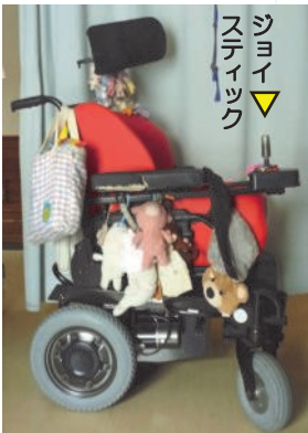
ジョイスティック

写真の物はバッテリー容量が大きく重い(85kg)ですが、モーターの力も強いので、長距離走行が可能です。