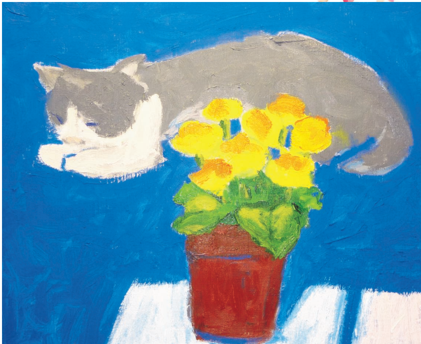
入居者さんクラフト講座作品