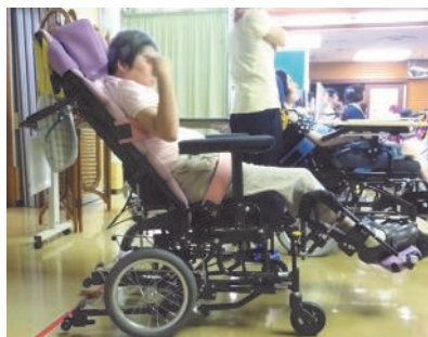
けいせいそんしょう

・長い時間車椅子に座る方、頸髄損傷の方は、定期的に除圧する必要があるため、臀部の除圧(角度50°以上)を目的としている、ティルト機構を使用しています。リクライニング機構でも除圧できるが、ティルト機構の方が優れています。