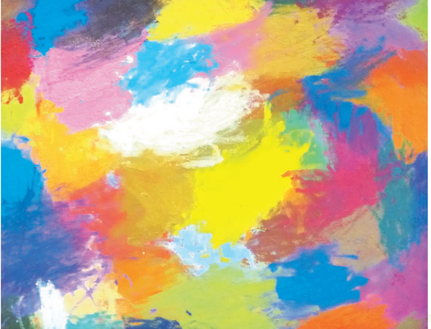
入居利用者さんクラフト講座作品