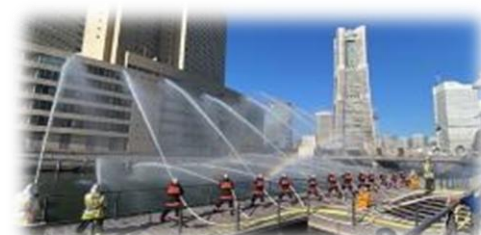
◆ 10/25「みのさわデー」にて ◆