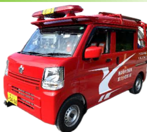
中六・3班の消防車 街で見掛けたら手をふってね！

第六地区を担当する中六・3班は、山元小横の器具置場を拠点に、毎月第1・第3日曜日に山元小校庭で放水訓練、毎月15日には火災予防の広報活動等を行っています。