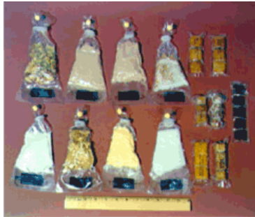
マーキュリー時代の宇宙食 (1962年~63年)