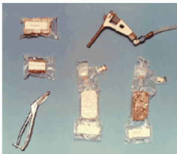
ジェミニ時代の宇宙食 (1963年~68年)