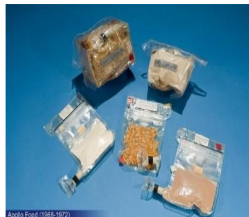
アポロ計画時代の宇宙食