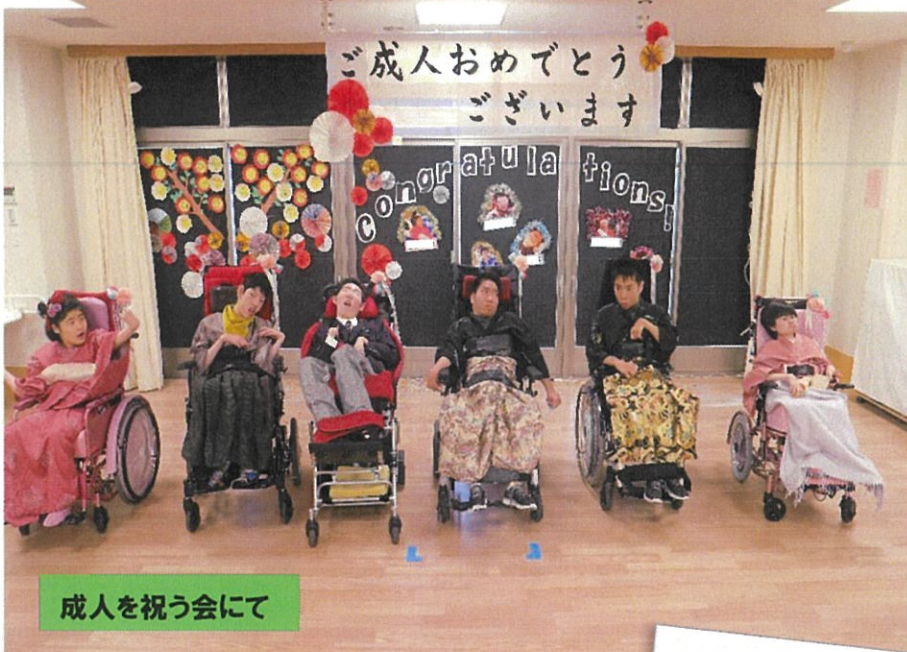
成人を祝う会にて